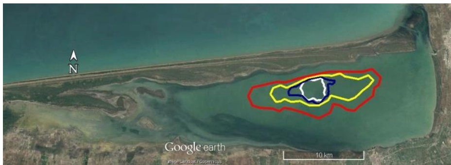
شکل (۲): تغییرات هندسی خلیج گرگان متأثر از مجموعه عوامل در نظر گرفته شده در هر سناریو (منحنی قرمز سناریو ۲، منحنی زرد سناریو ۵، منحنی آبی سناریو ۴ و منحنی سفید سناریو ۳ می‌باشد)