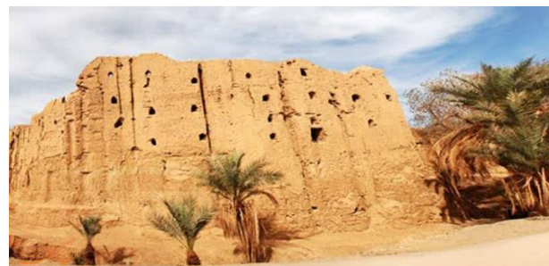
شکل (۳): قلعه باستانی بیاضه