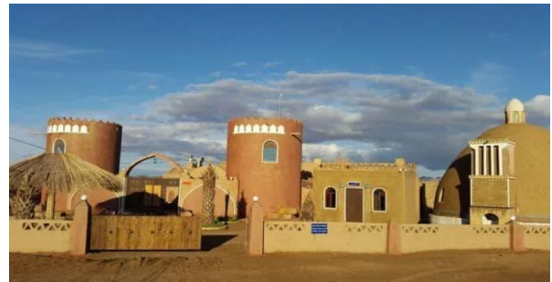
شکل (۲): روستای توریستی مصر

سطح دریا ۸۹۱ متر و تا تهران ۷۷۰ کیلومتر و تا یزد ۳۰۰ کیلومتر فاصله دارد (Boraghani Farahani et al., 2013). گرمه روستایی متمرکز و هسته‌ای است و مزارع و باغ‌های آن در فاصله کمی از خانه و خارج از بافت مسکونی قرار دارد (Alaeddini & Aminzadeh, 2014). روستای گرمه از نظر پراکندگی اراضی در نقاط: اصفهان - شهرستان نائین - بخش خور و بیابانک - دهستان - نخلستان - آبادی گرمه واقع شده است (boraghani Farahani et al., 2013).