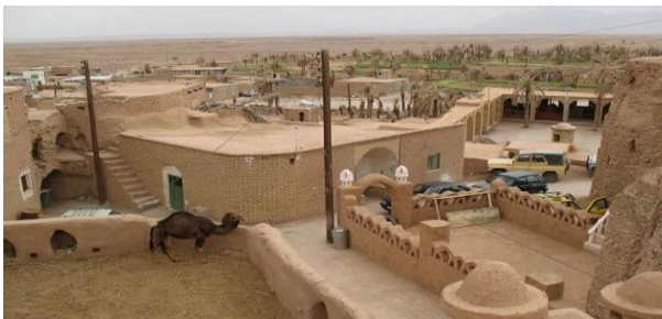
شکل (۴): روستای گرمه